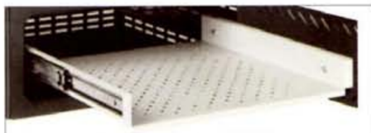
BANDEJA EXTENSIBLE SLIDING TRAY PLATEAU EXTENSIBLE